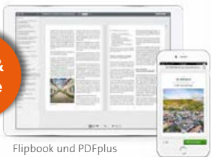
Flipbook und PDFplus