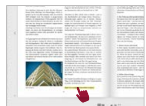
Auf Wunsch ist das Einfügen von externen Links möglich.